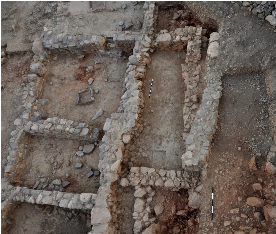
Εικ. 3: B800: ΥΜ ΙΙΙΓ Κτίριο