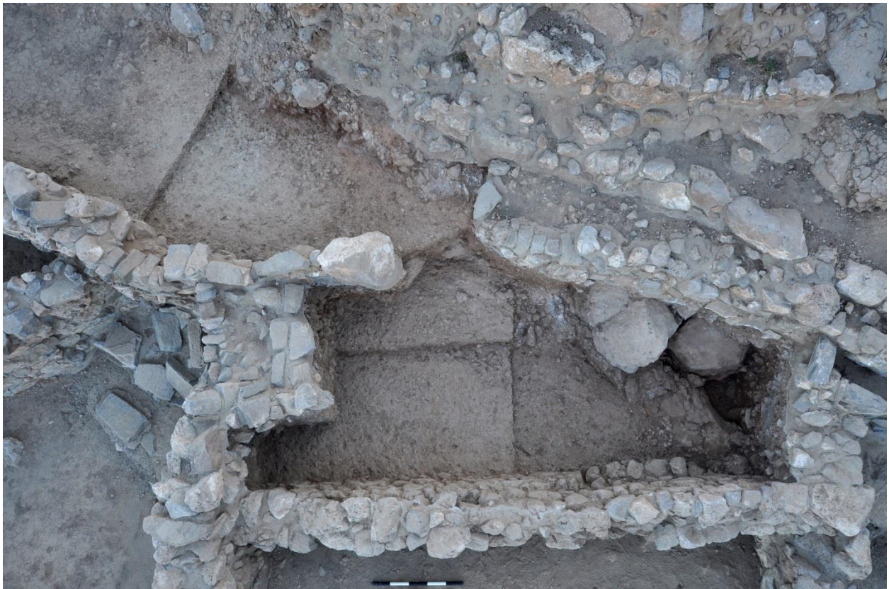
Εικ. 10: Επισκόπηση στις B4500 και B3000 φανερόνοντας τα 7 ου π.Χ. αιώνα στρώματα κατοίκησης