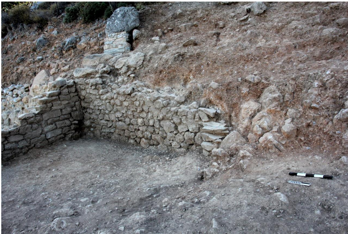
Εικ.2: D1700 από νοτιοδυτικά.