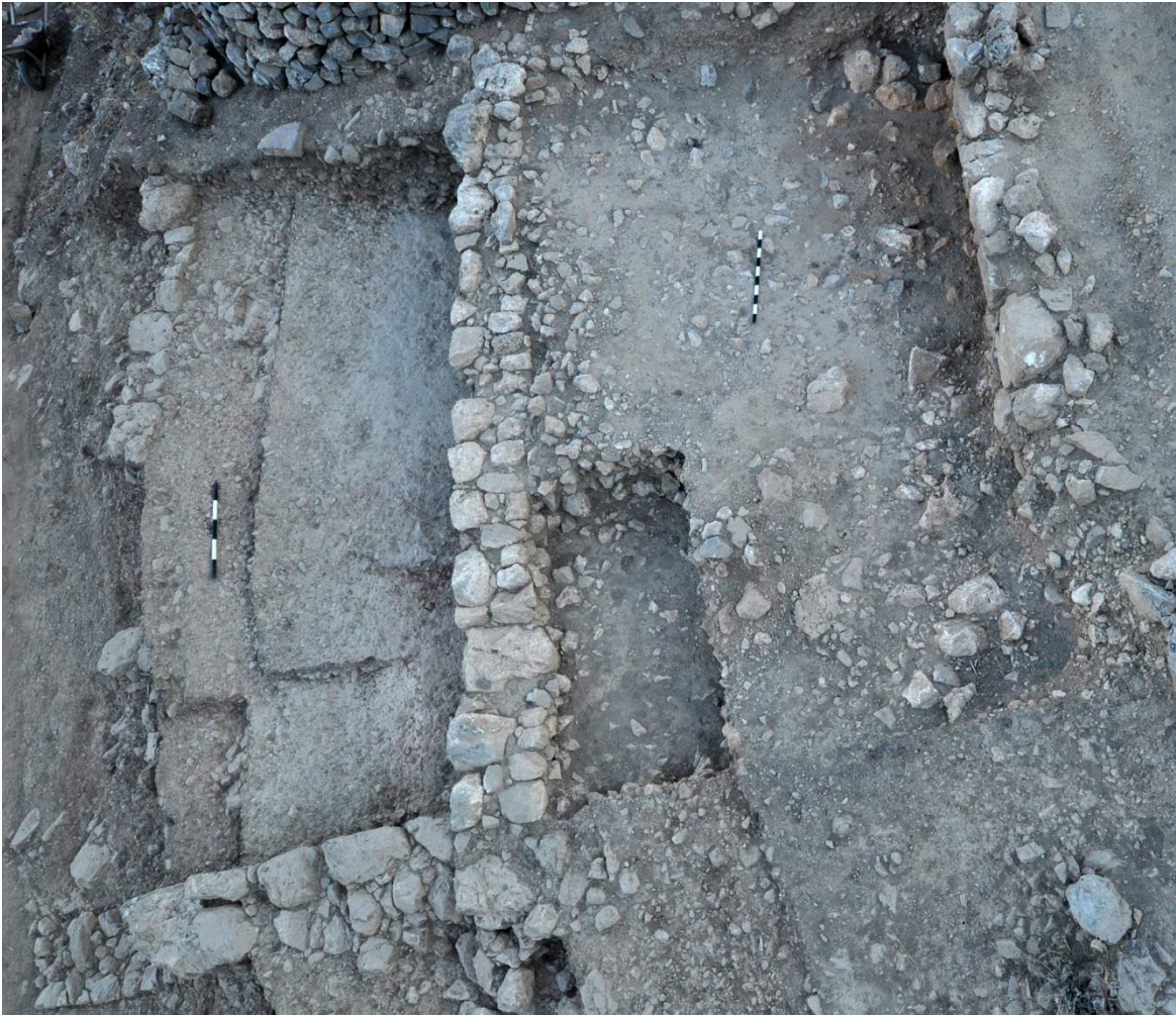
Εικ. 8: Δυτική επέκταση του Κτιρίου Συμποσίων (A3100).