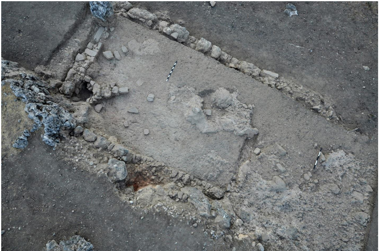
Εικ. 5: Νότιο Κτίριο 2 (G600).