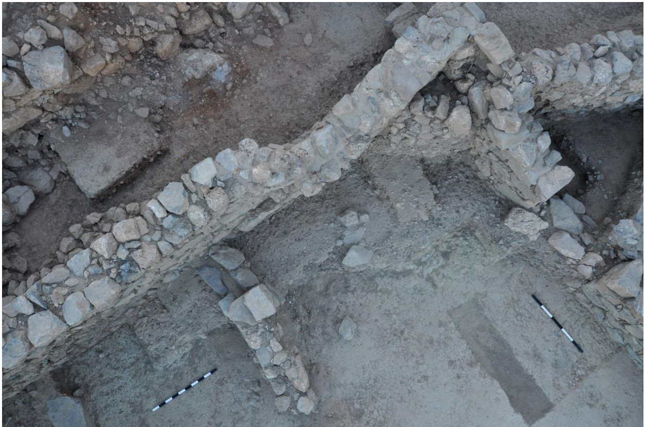
Εικ. 9: Επισκοπήσεις στο Κτίριο Πρώιμης Εποχής Σιδήρου/ Ανατολίζουσας (B4100).