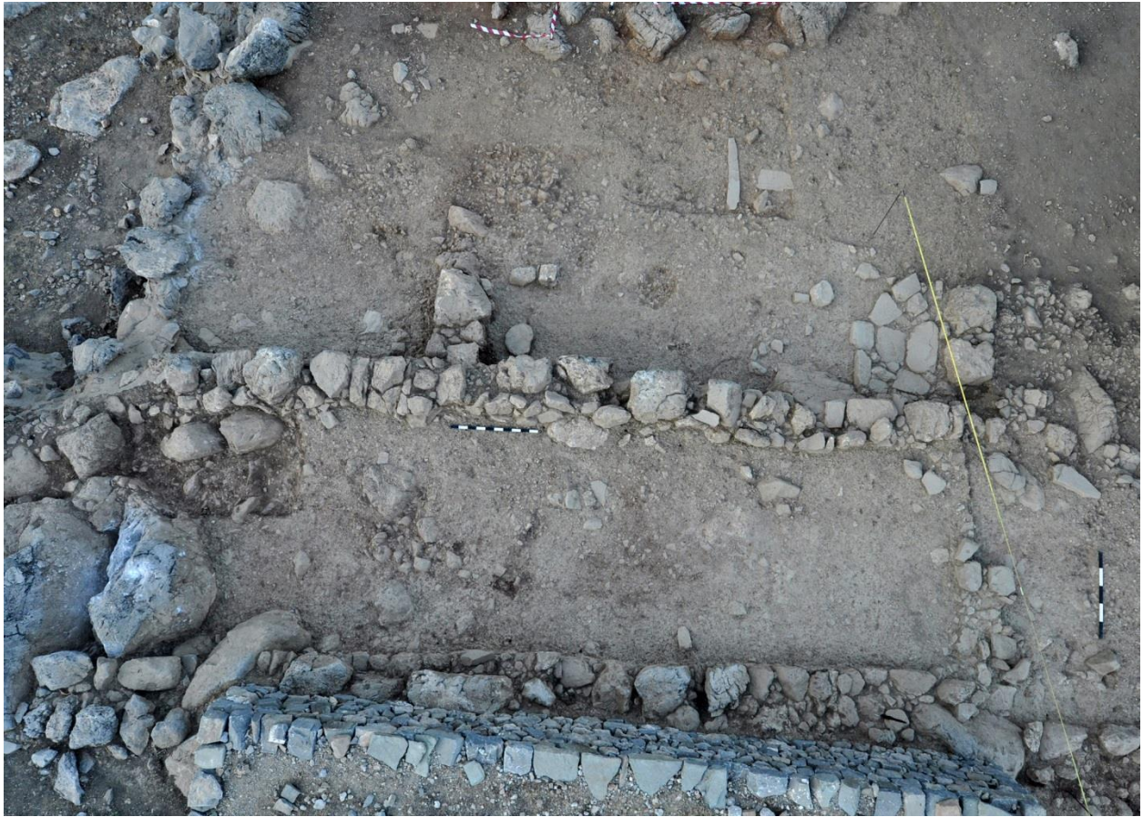
Εικ. 6: Κτίριο νότια των Κτιρίων της Νότιας Κλιτύος (G300, G500).