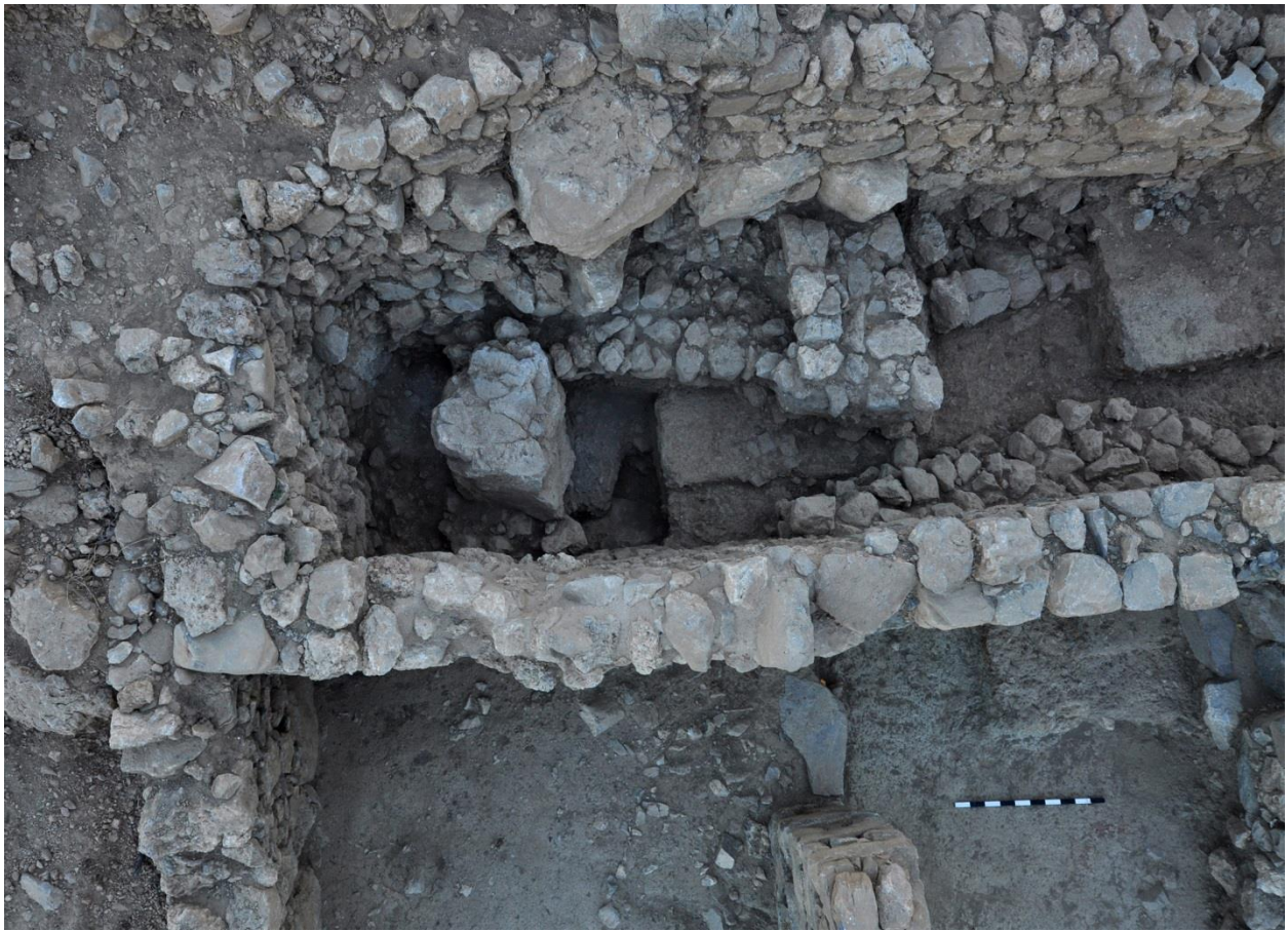
Εικ. 11: Κεραμικός κλίβανος (7 ος π.Χ.) (B4000).