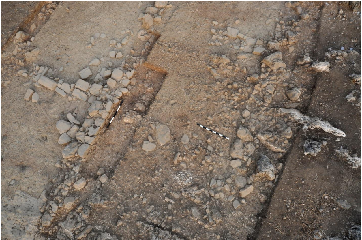
Εικ. 4: Νότιο Κτίριο 1 (G100, G400, G700).