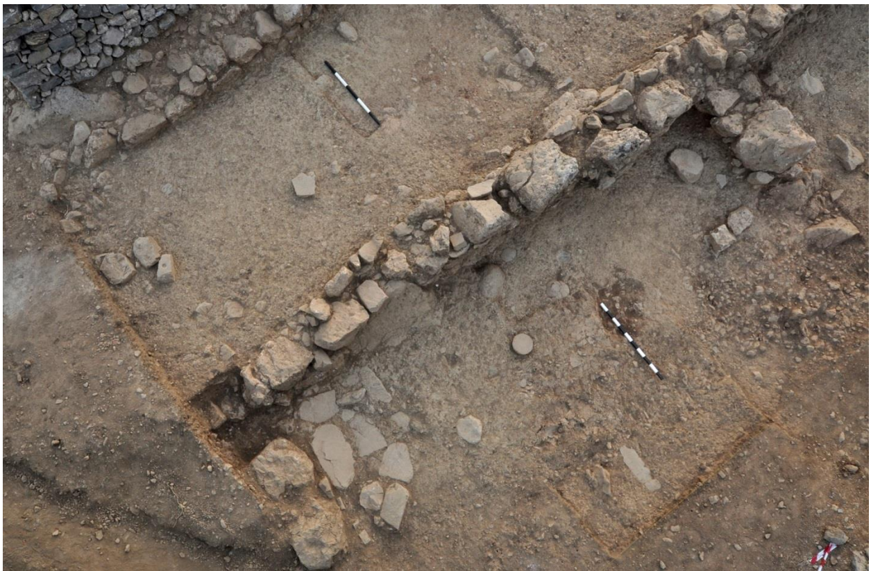
Εικ. 7: Κτίριο νότια των Κτιρίων της Νότιας Κλιτύος (G300, G500).