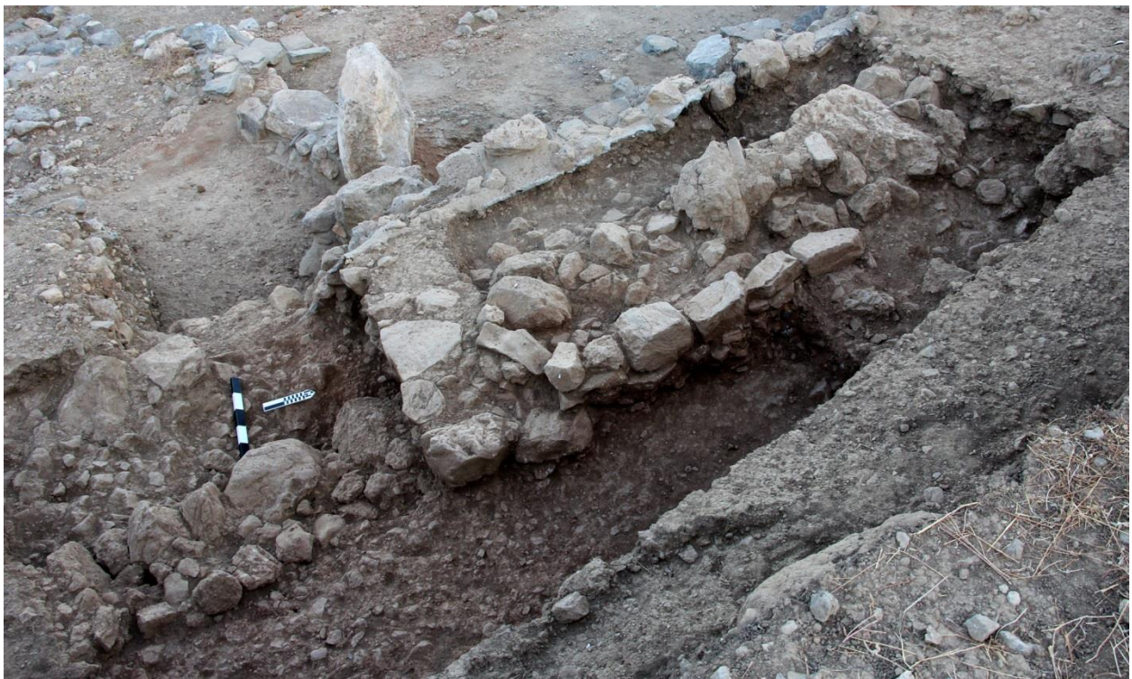
Ει. 12: ΥΜ ΙΙΙΓ τοίχος και περίβολος Ύστερης Γεωμετρικής-Πρώιμης Ανατολίζουσας εποχής (B5000).